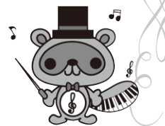
アフタヌーン・コンサート マスコットキャラクターたぬへん