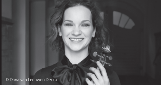
ヒラリー・ハーン (ヴァイオリン) Hilary Hahn, Violin