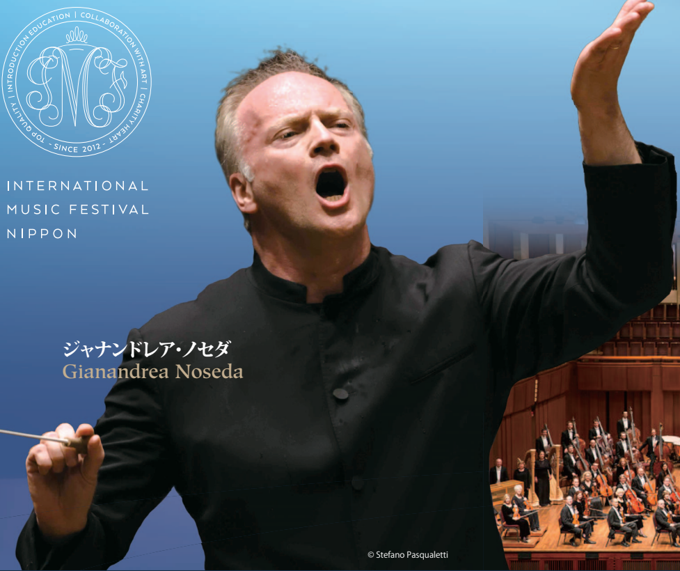
ジャンンドレア・ノセダ Gianandrea Noseda