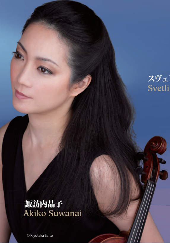
諏訪内晶子 Akiko Suwanai