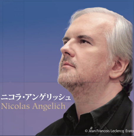
ニコラ・アンゲリッシュ Nicolas Angelich