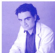
▲ロランド・ヴィラゾン グノー『ロメオとジュリエット』 出演予定