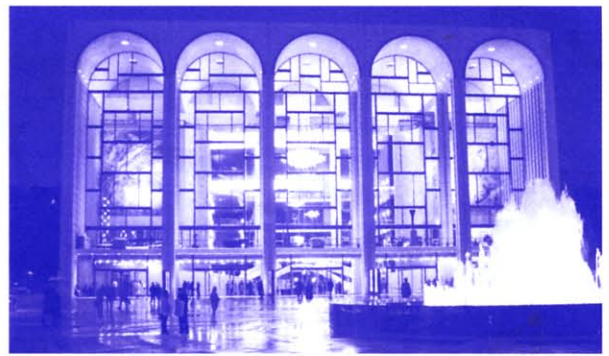
▲メトロポリタン・オペラ(外観)